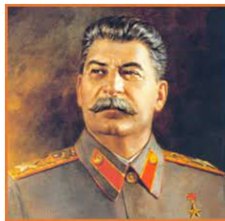
Josif Džugašvili Stalin

Svetovú globalizáciu po II. sv. vojne začal Dom Rothschild budovať nanovo a od základov znovu v Európe pomocou Európskeho spoločenstva, neskôr EHS a teraz v podobe Európskej únie, ktorá má v budúcnosti prejsť do Európskej federácie. Cieľom globalistov po II. sv. vojne bolo rozbiť Sovietsky zväz a dostať sa k zdrojom. Čiastočne sa to podarilo, pretože zväzové republiky ZSSR sa odtrhli a ten zanikol. Lenže najviac zdrojov leží na území Ruska, nie v okolitých bývalých zväzových republikách. A rozbitie Ruska sa globalistom nepodarilo, aj keď podnecovaním islamského separatizmu v Čečensku a v Dagestane sa o to obrovsky snažili. Stopku tomu koncom 90. rokov vystavil Ruský židovský kongres (RŽK), nepriateľ Domu Sion, ktorý si v Rusku do funkcie prezidenta nainštaloval vlastného židovského kádra, rozviedčíka KGB, Vladimíra Putina z Leningradu.